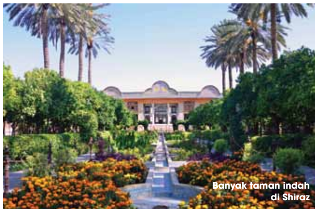
Banyak taman indah di Shiraz