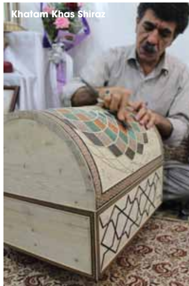
Khatam Khas Shiraz

▶ Matahari di lokasi sangat terik, dianjurkan berkunjung pagi hari, membawa payung ataupun topi lebar.