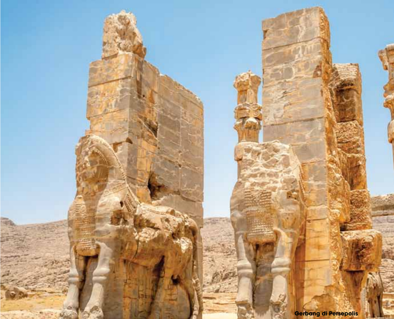
Gerbang di Persepolis